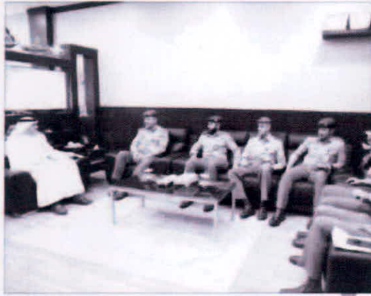
وفد الحرس الوطني خلال زيارته للتطبيقي